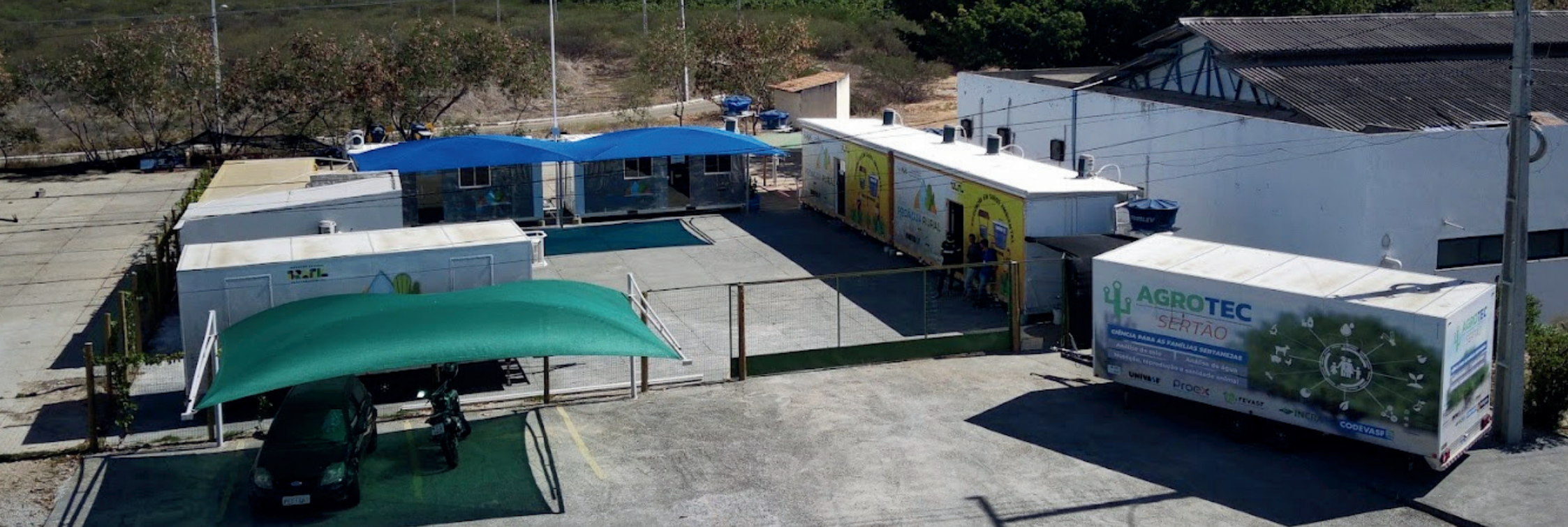
Vista aérea da sede do Proágua Rural – Centro de Ciências Agrárias/UNIVASF