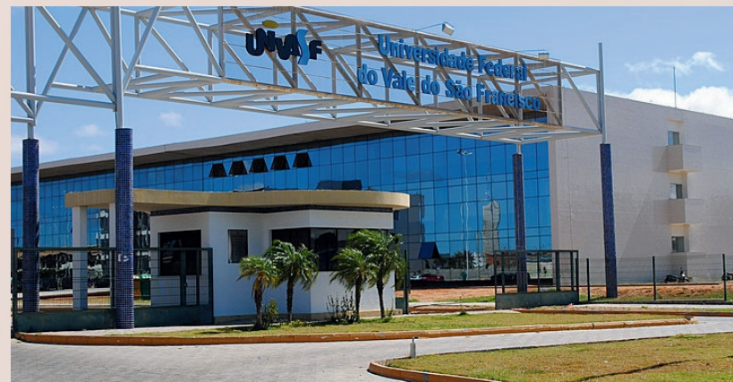
Reitoria da UNIVASF - Petrolina/PE

O Termo de Execução Descentralizada n.º 951532/2023 SNSA/MCID/UNIVASF - Projeto Plansanear - executado pela Universidade Federal do Vale do São Francisco (UNIVASF), em parceria com o Ministério das Cidades, através da Secretaria Nacional de Saneamento Ambiental (SNSA), tem como objetivo a capacitação e o fornecimento de suporte técnico especializado para a elaboração de Planos Municipais de Saneamento Básico (PMSBs) para Municípios dos Estados do Rio de Janeiro, Pernambuco e Bahia .